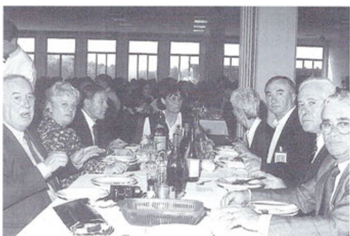
I "vecchi" della 2ª Aerobrigata