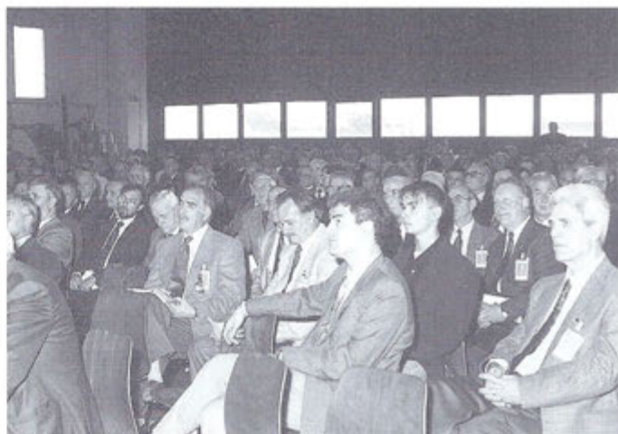
Numerosi altri soci in Assemblea