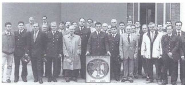
40° Anniversario fondazione Direzione Lavori Demanio Cameri 13 maggio 1995