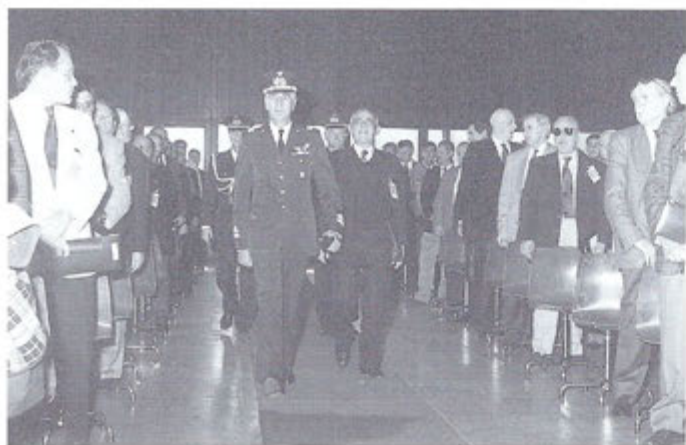
Ingresso del Com.te 1° R.A. e del Presidente