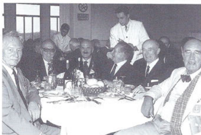
I piloti 'fondatori' del 53° Stormo