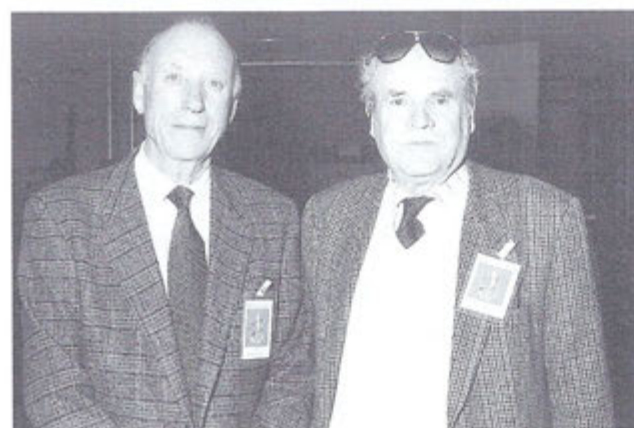
Due simpatici soci...