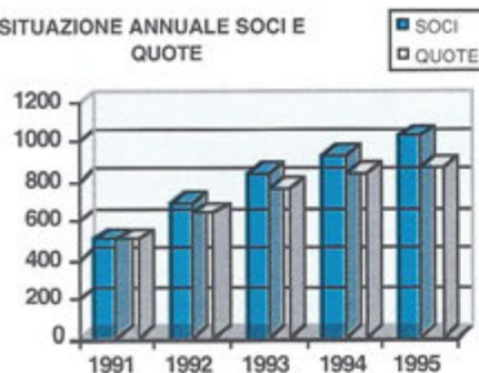
SITUAZIONE ANNUALE SOCI E QUOTE