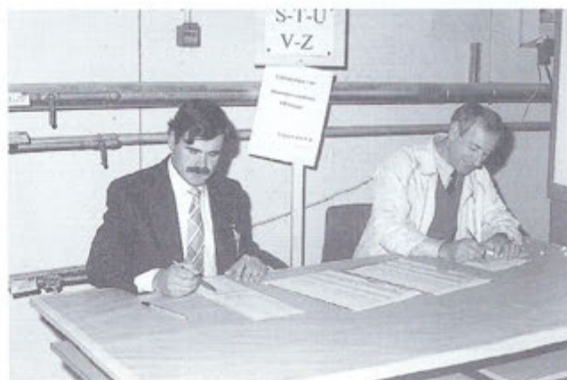
Gli Aiutanti Cinini e Tretotola