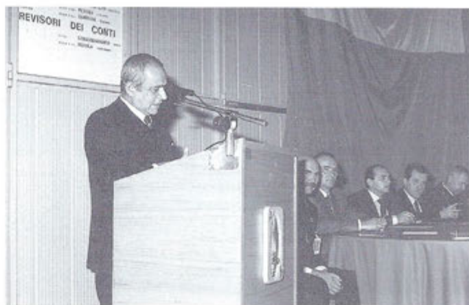
La relazione del Presidente