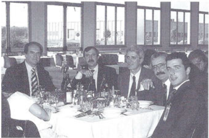
Le Tigri del 21° Gruppo