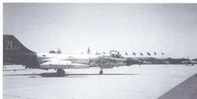
Il 104 Tigrato partecipa al suo ultimo Tiger-Meet Beja 21-29 maggio 1996