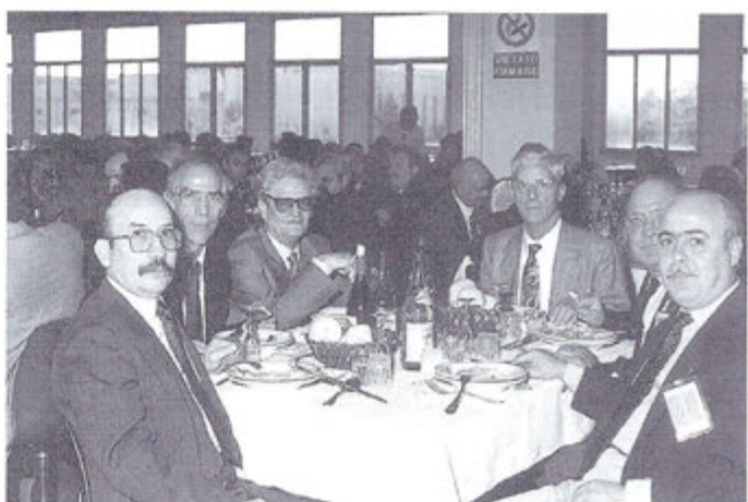
M.lli in Ausiliaria dei vari reparti dello Stormo