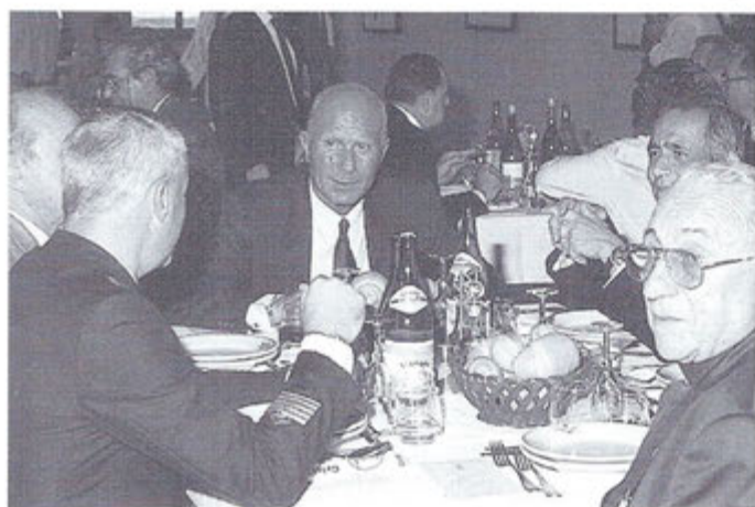
La Presidenza del Circolo del 53