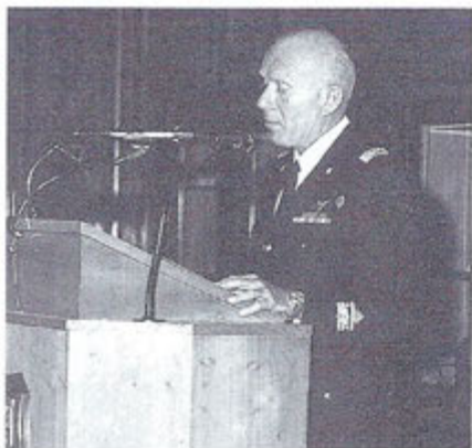
GEN. B.A. GIULIO MAININI, CAPO DEL 5° REP. S.M.A.

Corso Centauro 3° dell'Accademia. Ha prestato servizio a Cameri dal 1969 al 1978. È stato Comandante del 21° Gruppo e Capo