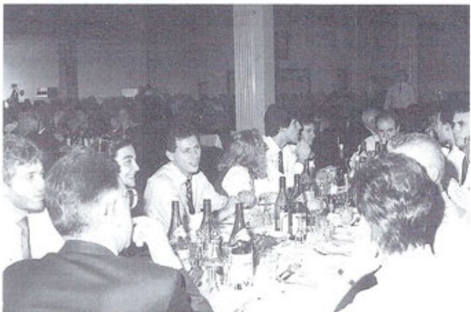
Giovani ufficiali del G.D. ora in congedo