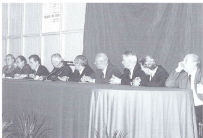
Il tavolo del Consiglio Direttivo