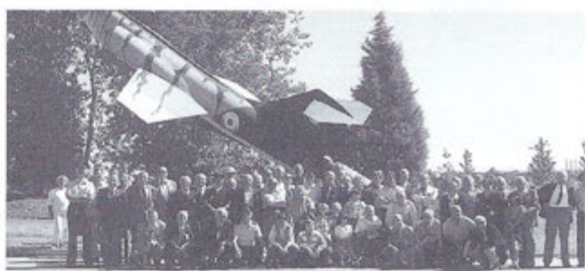
34° Raduno Nazionale degli Alantisti Militari Cameri, 8 settembre 1996