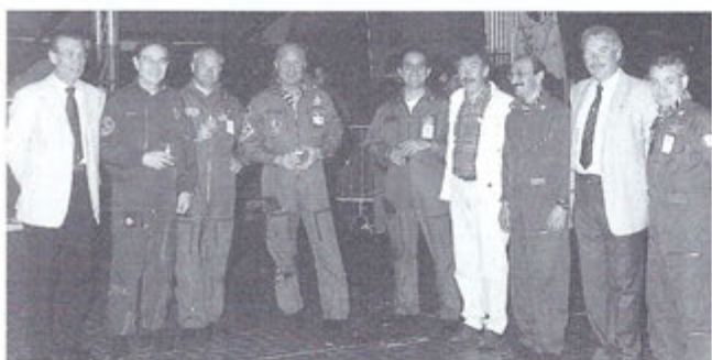
Ultimo allarme del 21° Gruppo con l'F104 Cameri 12 aprile 1996